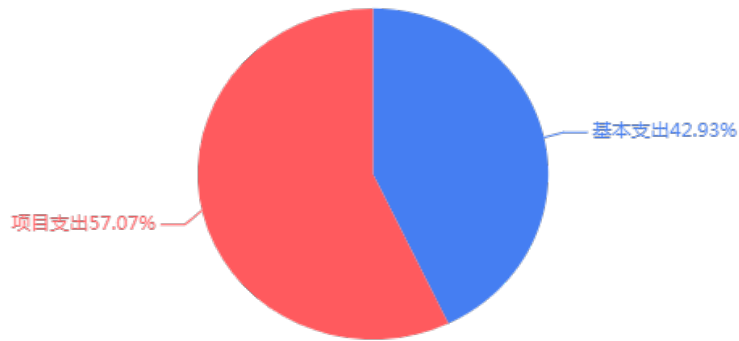
图3：本年支出构成情况