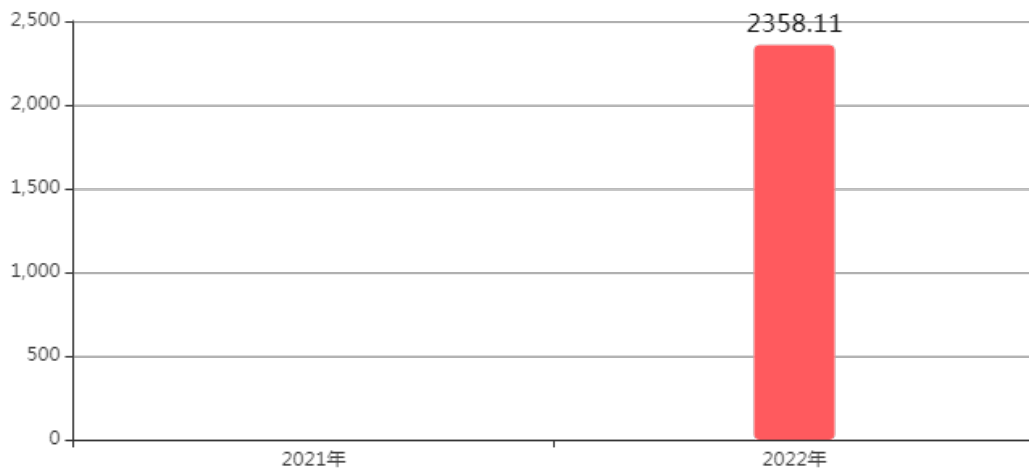
图1：收入支出决算变动情况 (单位：万元)

2022年度收、支总计均为2,358.11万元。与2021年度相比，收、支总计各增加1,118万元，增长90.15%。主要是21年度欠款，22年支付增加。