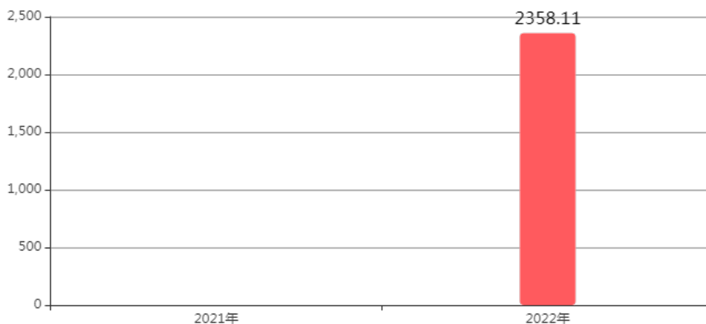
图4：财政拨款收、支决算总计变动情况 (单位：万元)