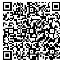
退税减税降费政策 清单及操作指引