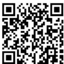
组合式税费支持政策

“国家税务总局”“山东税务”“山东税务服务”“淄博税务”微信公众号、“国家税务总局”“山东省税务局”官方网站、“鲁税通山东税务征纳互动平台”、12366 纳税服务热线。如扫描下方二维码，可获取 2022 年组合式税费支持政策、2019 年以来新出台和延续实施的税费优惠政策及操作指引等具体内容。