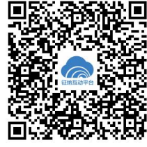
鲁税通征纳互动平台